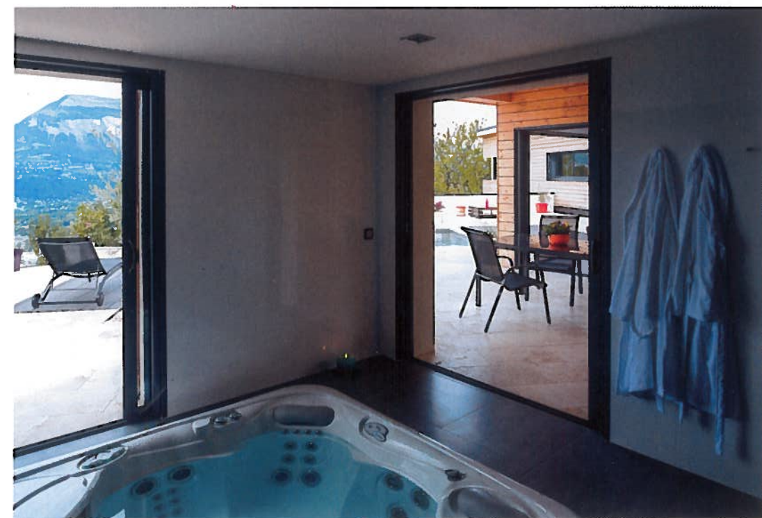
Esprit spa. Lieu de détente privilégié, le jacuzzi, spacieux, occupe une pièce dédiée à quelques mètres de la piscine.