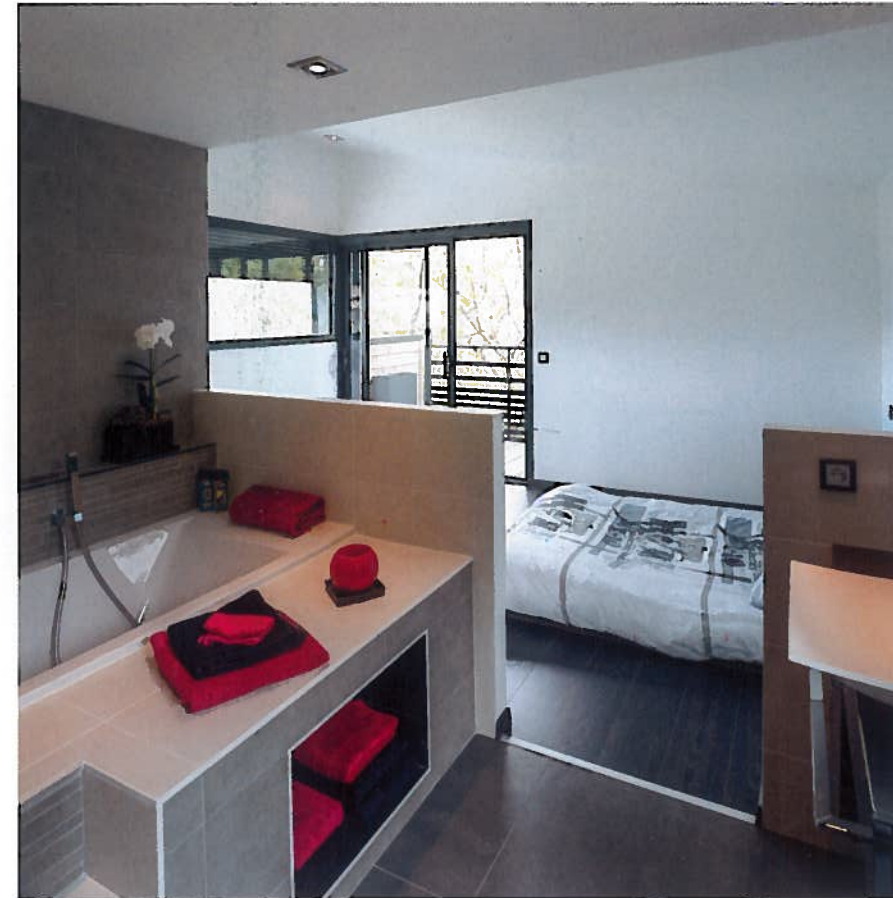
Spacieuse. Une des deux chambres d'hôtes comprend une salle de bains ouverte sur la partie nuit ainsi qu'un accès au balcon.