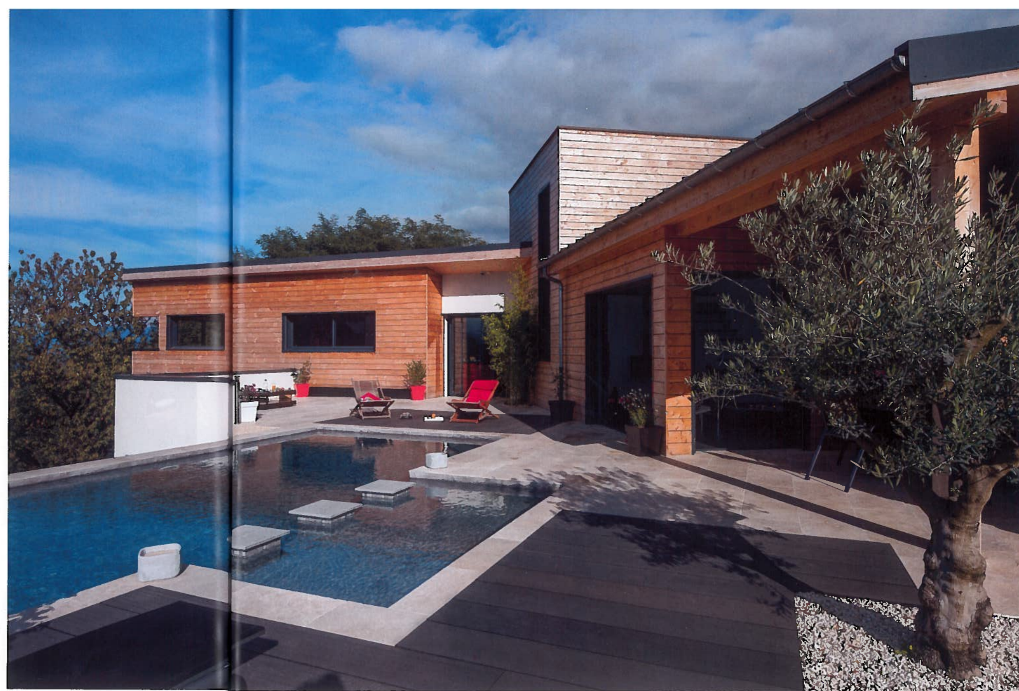
Panorama. C'est un véritable belvédère sur les massifs de la Chartreuse, du Vercors et de Belledonne que constitue cette maison bâtie sur cette commune d'Isère.