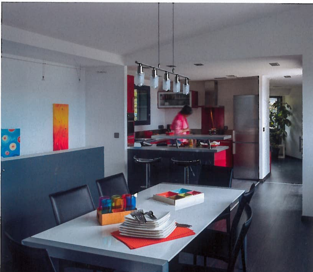
Espace repas. La cuisine est ouverte sur la salle à manger. Les maîtres des lieux ne perdent ainsi pas une miette des conversations de leurs invités.