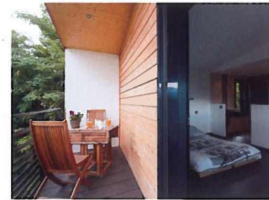
Intime. La seconde chambre d'hôtes joue plutôt la carte de l'intimité préservée avec sa salle de douche bien séparée de la chambre.