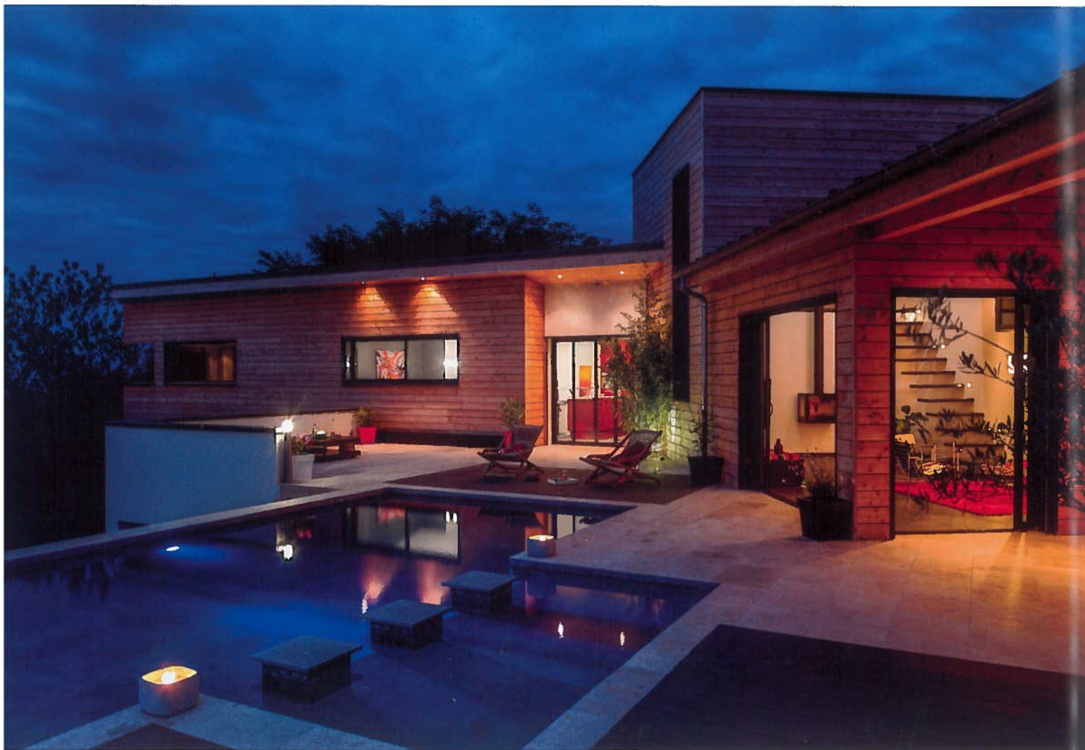
Bassins. La piscine a été construite dans un second temps. La simultanéité des travaux n'était pas recommandée par l'architecte.