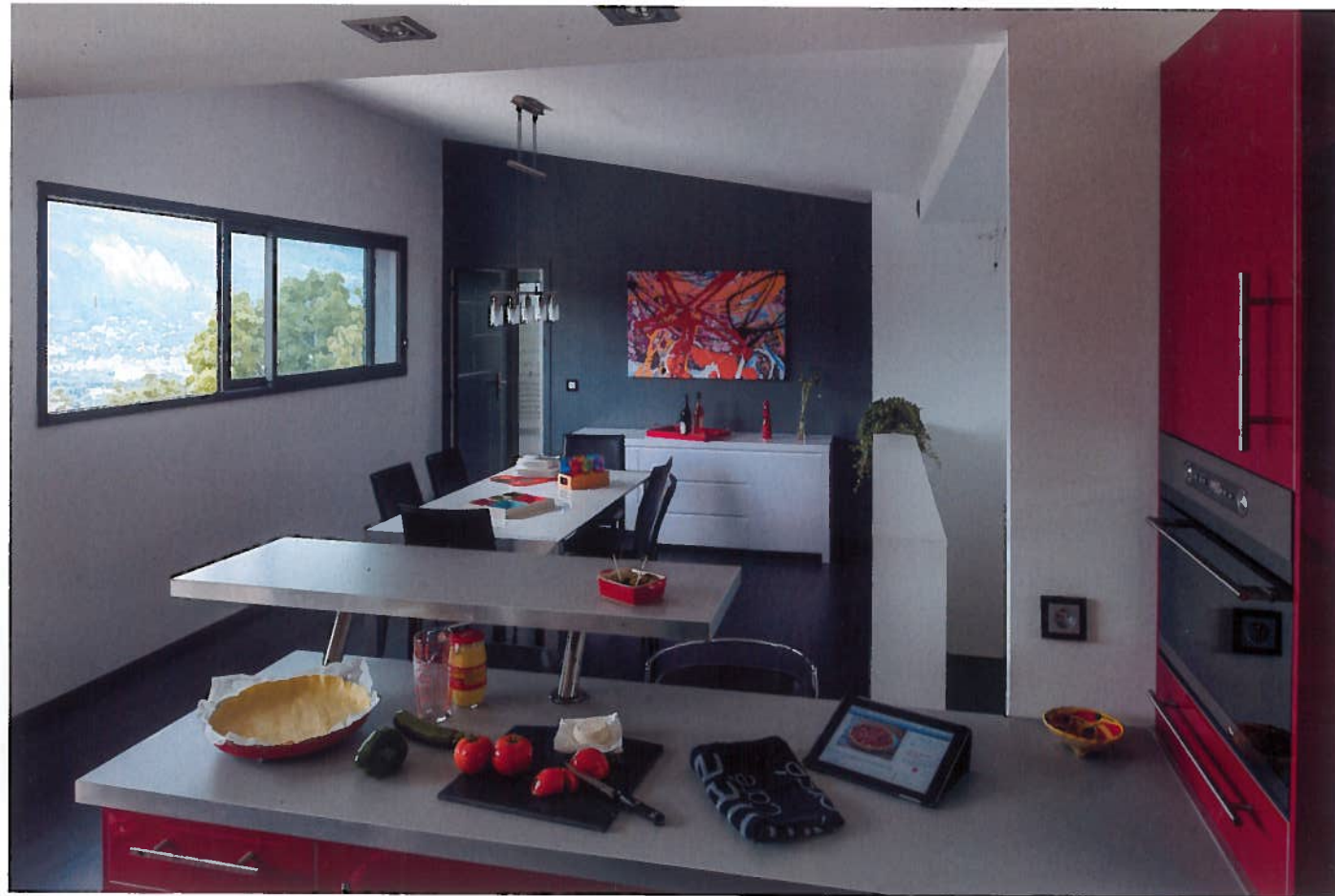
Carrefour. La salle à manger bénéficie de la vue et de la lumière naturelle grâce à de grandes baies vitrées horizontales. Elle donne accès à la buanderie et au garage en dessous par un escalier dissimulé derrière un mur à mi-hauteur.